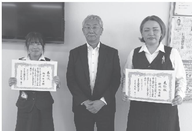
社員勤続表彰総会