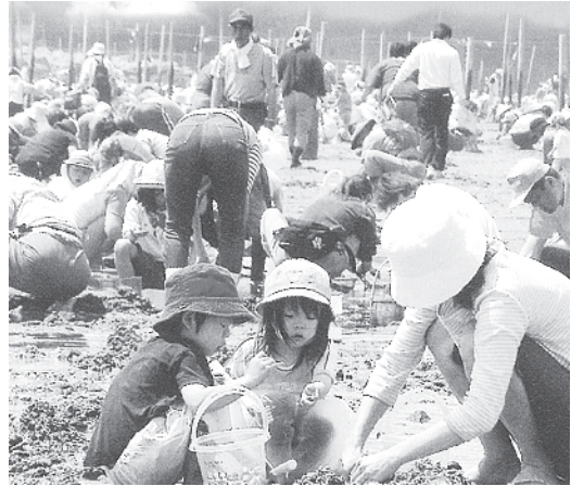
〔西尾観光ガイドマップより〕

潮干狩が楽しめる時間帯は、日付、場所によって異なりますので干潮時刻をご確認ください。干潮の2時間前程度から干潮までが最適です。ただし、土日・祝日は交通渋滞の可能性がありますのでご注意ください。